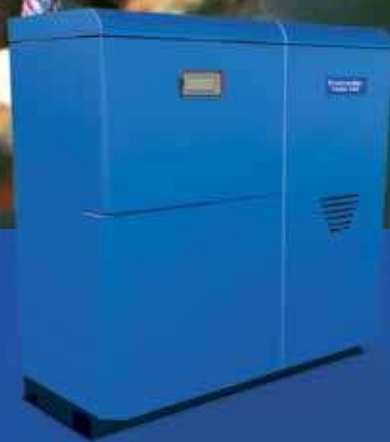
Krommler Pellet 500

Automatycznie rozpalane kotły Krommler Pellet 500 o mocy do 25 kW zasilane są ekologicznym peletem. Oferują źródło ciepła atrakcyjniejsze w stosunku do gazu i dwukrotnie tańsze od prądu czy oleju opałowego, a do tego pomagają chronić środowisko naturalne! Poza tym kotły te są wyjątkowo łatwe w obsłudze – sterownik kontroluje automatycznie proces spalania i umożliwia pracę we właściwym zakresie temperatur, a zasobnik pozwala na długi okres pracy bez konieczności dokładania paliwa. Współpracując z podgrzewaczami c.w.u. kotły Krommler Pellet 500 stają się niezawodnym i samoregulującym źródłem ciepłej wody użytkowej.