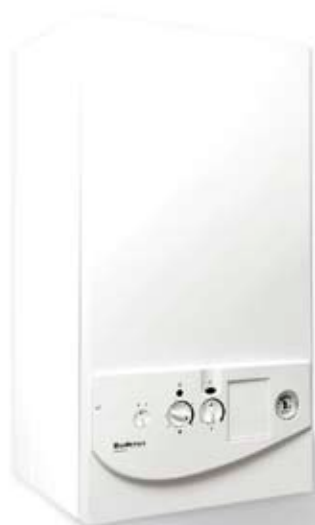
Logamax U022/024 K

Nasze konwencjonalne kotły grzewcze Logamax U022/U024 K przeznaczone są do zasilania instalacji c.o. w energię ciepłą oraz przygotowania ciepłej wody użytkowej (na zasadzie priorytetu). Modele te służą do ogrzewania mieszkań w budynkach wielorodzinnych, domów jedno- i dwurodzinnych, o powierzchni sięgającej 300 m 2 .