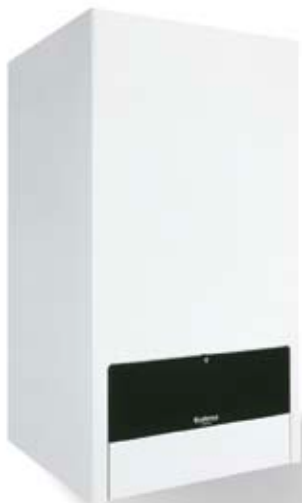
Logamax U052/054 K

Kotły Logamax U052/U054 K pracują z wytrzymałym, miedzianym wymiennikiem ciepła „rura w rurze”. Konstrukcja kotła zmniejsza zagrożenie odkładania się osadu kamiennego i wpływu na wodę pitną a parametry spalania są optymalnie ustawione dla pracy bez kondensacji. Cechy te podwyższają bezpieczeństwo użytkowania i długowieczność.